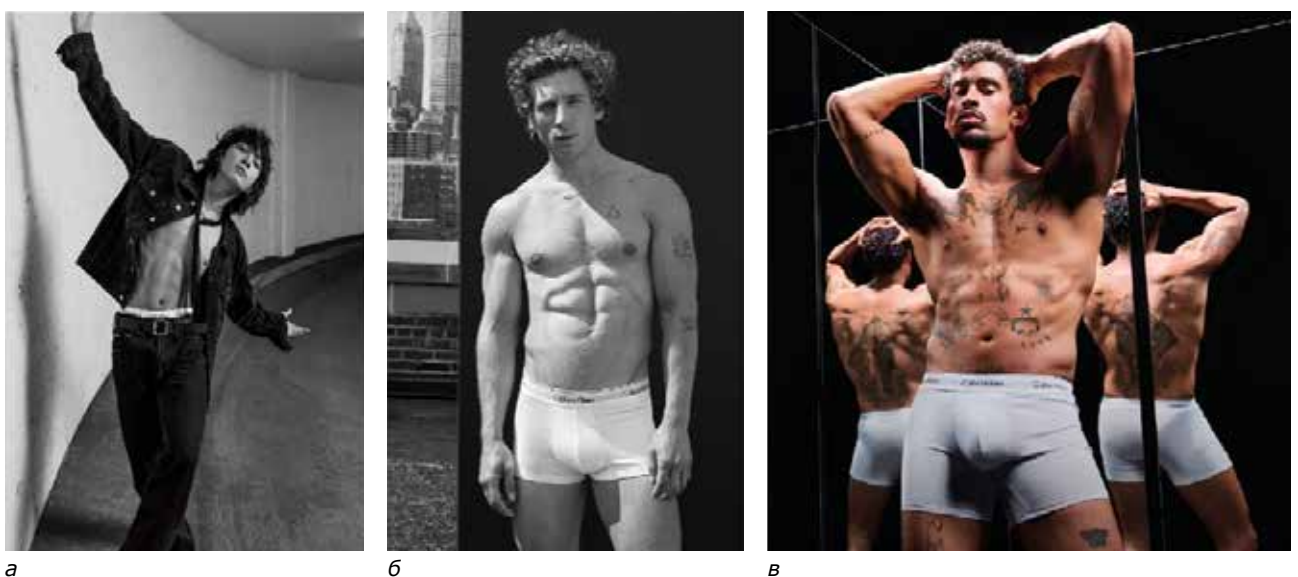
Рис. 3. Брендинг Calvin Klein 2023–2025 рр. за участю відомих особистостей: а – Чон Джонгук; б – Джеремі Аллен Уайт; в – Bad Bunny

Протягом останніх років відбувається перехід від відомих особистостей як спонсорів до розробників власних брендів одягу. Так, наприклад, Кім Кардашьян, продовжуючи рекламувати продукти, розвиває власний бренд – образ відомої персони сприяє пізнаваності. Кім Кардашьян дуже популярна і впізнавана, починаючи від її зовнішності та голосу, закінчуючи брендингом, який вона використовує у своєму телешоу. Люди, які бачать її продукцію на шоу або в соціальних мережах, купують її, намагаючись наслідувати Кім, багатий стиль життя, красу та індивідуальність, оскільки це дає змогу споживачам «володіти» частиною її слави [14, с. 4].