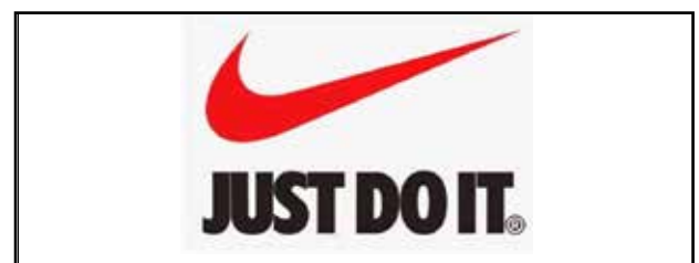
Рис. 1. Логотип і девіз бренду Nike

Ключову роль у формуванні сприйняття та емоцій у світі fashion-брендингу та створенні унікальної ідентичності бренду відіграє