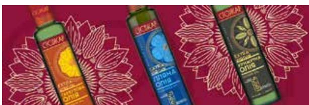
Рис. 5. Серія етикеток для преміальної лінії олій ТМ «Стожар» [18]

Квіти стилізовано методом трансформації, унаслідок чого природні форми набули узагальненого, плоскісного характеру. Їх декоровано різноманітними лініями, що імітують текстуру пелюсток і водночас нагадують народний орнамент. Ці графічні елементи повторюються по всій площині етикетки