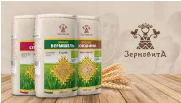
Рис. 4. Логотип і упаковка ТМ «Зерновита» [16]

розміщено схематичний образ дівчини, яка тримає пташок у двох руках. Знак доповнений декоративними елементами: лініями та крапками, які підсилюють орнаментальний характер зображення та забезпечують візуальну єдність із традиційними мотивами народного мистецтва. Цей проєкт вирізняється поєднанням сучасних графічних прийомів із народними мотивами, що відображає прагнення українських брендів до осмисленої візуальної ідентичності, заснованої на культурних традиціях і природній символіці.