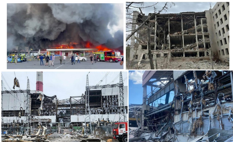
Рис. 1. Пошкодження об'єктів громадської та цивільної інфраструктури у Полтавській області ( ТЦ «Амстор» м. Кременчук, Інститут зв'язку, м. Полтава, Кременчуцька ТЕЦ, Завод дорожніх машин, м. Кременчук)

наведених графіків можливо виключно у ручному режимі, що значно збільшує тривалість розрахунків, допускає помилки внаслідок суб'єктивної оцінки значень.