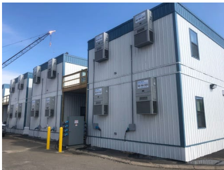
Рис. 1. Комплекс модульних будівель Wilmot в міжнародному аеропорту Даллеса

На традиційних будівельних об'єктах модульного офісного вагончика було б достатньо для забезпечення офісного простору проекту. Проекти в аеропортах часто більші за масштабом, а це означає, що потрібно більше місця для розміщення підрядників і робітників. Багатоповерхова модульна будівля або великий модульний комплекс, який можна переміщати по ходу будівництва, є оптимальним рішенням. Будівельні офіси в проектах аеропортів часто доводиться розташовувати в нетрадиційних місцях. Наприклад, комплекс модульних будівель Wilmot в міжнародному аеропорту Даллеса (рис.1). Цей комплекс використовувався як офіс для проекту розширення, а потім був перенесений поруч зі злітно-посадковою смугою і дообладнаний спринклерною системою для використання в якості станції антиобледеніння.