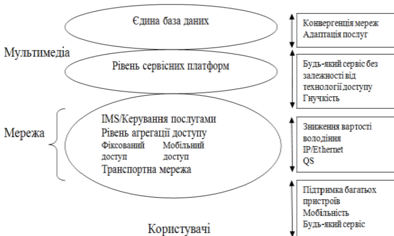
Рис. 3. IMS – єдина інфраструктура для всіх типів послуг та пристроїв (адаптовано з [4])

В [4] надається варіант зображення IMS як єдиної інфраструктури для всіх типів послуг та пристроїв (рис. 3).