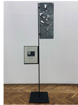
Рис. 5. «Храм Сивілі в Тіволі», 2023, Нікіта Кадан [16]

перетворюється на матеріальну мантру опору насильству [17; 23].