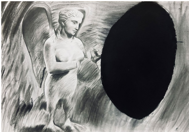
Рис. 4. «Сирена Києва», 2025, Нікіта Кадан [16]

Серія «The Siren's Song» (приблизно 2022–2024) (рис. 4, 5) включає живописні зображення сирен, воєнних руїн і грецьких античних артефактів із колекцій українських музеїв, пограбованих російською армією [16]. Художник поєднує мотив сирени як повсякденного досвіду повітряної тривоги в Києві з образом античних статуй-сирен, створюючи складний образ культурної спадщини, що опинилася під загрозою фізичного знищення та символічного привласнення [16; 23].