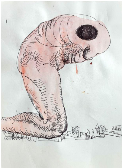
Рис. 2. Аркуш із серії «Львівський щоденник», 2022, Влада Ралко [15]

Після 2022 року Ралко створює «Львівський щоденник» (рис. 2) – серію графічних робіт, тепер уже безпосередньо присвячених війні РФ проти України [15]. У колекції Львівської національної галереї мистецтв відзначено, що ці аркуші виконані змішаною технікою (акварель, кулькова ручка, маркер) та тематизують війну як безперервний досвід; художниця прямо говорить, що створює ці малюнки, «бо не хоче мовчати» [15].