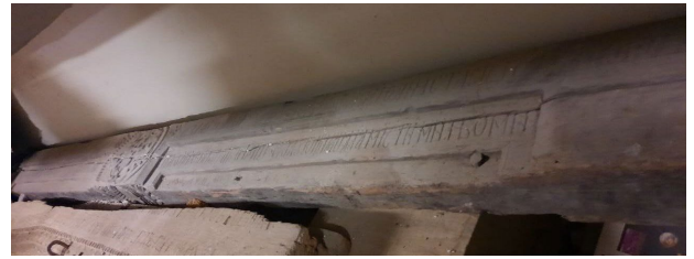
Рис. 4. Сволок Анастасії Деркач.

Унікальний приклад, що відображає релігійні уявлення, культурну спадкоємність і роль жінки в суспільстві козацької доби – сволок що експонується у Дніпропетровському національному історичному музею ім. Д. І. Яворницького, датований 25 квітня 1733 року (рис. 4). Це один із найдовших відомих зразків, який має конструктивну особливість перекривав два приміщення різної ширини. Замовницею сволока була Анастасія Деркач вдова та власниця шинка в Переволочній. Імовірно походження балки – село Китайгород на Дніпропетровщині. До музею балка потрапила у 1927 р. завдяки зусиллям Д. Яворницького [18, с. 182–188].