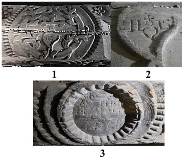
Рис. 3. Фрагменти різьблених сволоків ранньомодерної доби.

Під час його встановлення здійснювалися ритуальні дії: у заглиблення, куди його вкладали, клали монети, як символ матеріального достатку. З метою духовного захисту дому у східному куті приміщення розміщували освячені церковні предмети, ладанки, а у західному куті гроші й хліб. Сволоки постійно утримували у чистоті, перед великими святами його білили, мили, підфарбовували. У Чистий четвер на ньому викопчували хрест за допомогою свічки, принесеної зі Служби Божої, а на Водохреща малювали хрест крейдою. На його поверхні зберігали пічне начиння та лікарські рослини, що додавало сволоку ще й утилітарно-магічної функції. У другій половині XIX – XX ст. були записані етнографічні матеріали, які свідчать, що сволок умовно поділяв хату на два світи: простір від дверей до покуті був призначений для гостей; простір за сволоком був закритим для сторонніх, символізуючи світ сім'ї [16, с. 175–179].