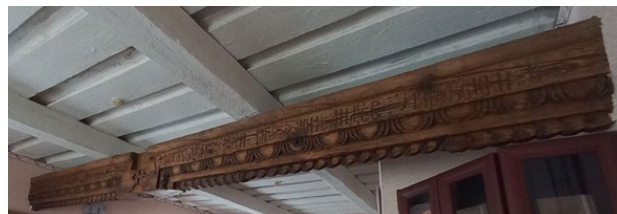
Рис. 2. Сволок у хаті мірошника. Комплекс споруд «Двір мірошника», м. Переяслав [8]

Однією з найдавніших конструктивних деталей у традиційному будівництві є сволок – центральна балка перекриття стелі дерев'яної споруди зрубної чи каркасної конструкції (рис. 2). В різних регіонах використовувалися своєрідні назви таких балок. Але найбільш поширеним, загальнозрозумілим було слово «сволок». Воно похідне від дієслова «волочити» й означає «той, що стягує».