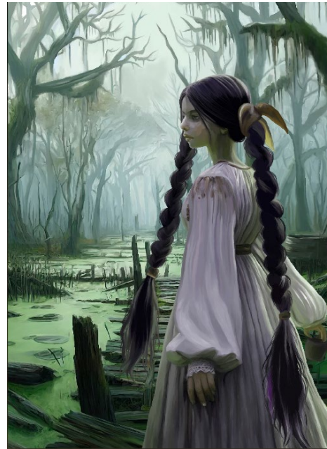
Рис. 1. Луїза Єфімова. Бродниця. Ілюстрація у складі бакалаврського проекту (2024)

Це особливо помітно в умовах глобалізації візуальної культури, коли локальні міфологічні мотиви підпадають під вплив загальносвітових стилістичних трендів і частково, або максимально наближаючись до реалізму, уподібнюються до героїв кінострічок [17]. Дослідження Н. Адамо-Віллані та ін. показало, що візуальний стиль персонажа не має значного впливу на зрозумілість його дій, однак суттєво впливає на рівень зацікавленості аудиторії. Стилiзовані персонажі сприймаються більш привабливо, ніж реалістичні, що може бути пов'язано з ефектом «зловісної долини»