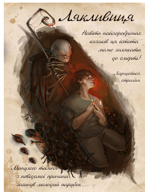
Рис. 2. Дар'я Ніка. Ляклиця. Ілюстрація до артбуку «Польові нариси»(2022, с.74)

(англ. uncanny valley) [12]. Сутність цього ефекту полягає в тому, що людина, стикаючись з зображеннями, реальними або віртуальними моделями істот, що виглядають подібно до людини, але не є людьми, або частково відрізняються від людей, отримує дивне відчуття тривоги або відрази, що позбавляє її бажання подальшого продовження контактів.