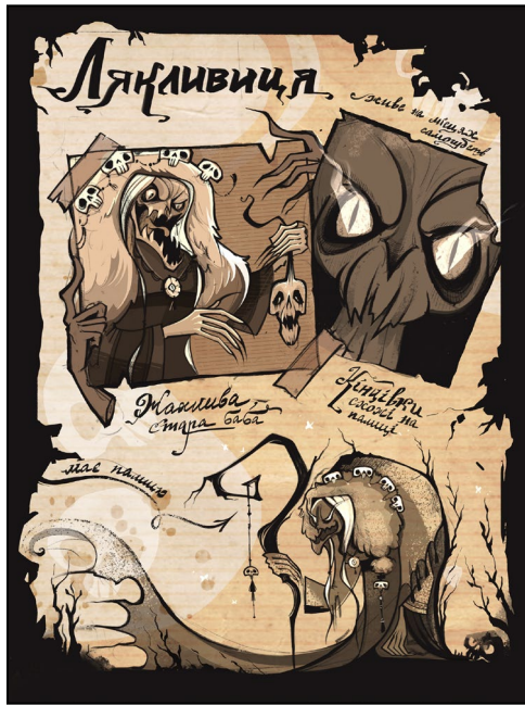
Рис. 6. Влада Федченко. Лякливиця. Ілюстрація до артбуку «Польові нариси»(2022, с.76)

деталей, концентруючи увагу на ключових смислових елементах [9, с. 45–46]. У поєднанні з міфологічною тематикою це дозволяє створювати образи, що легко зчитуються та зберігають високий рівень символічної насиченості.