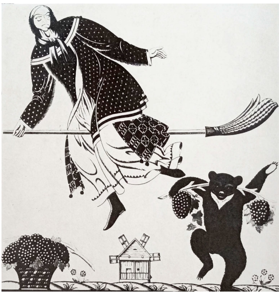
Рис. 9. Г. Нарбут. Ілюстрація до української абетки. Літерв «В». Альбом (1983). Репродукція 68.

Засоби стилізації, автентично відповідні саме українській культурі, напружено шукали у своїх роботах значна кількість українських митців, серед яких маємо виділити ілюстрації Г. Нарбута [1] до української абетки, в яких спрощені силуети, доповнені та збагачені вкрай вираженими деталями, складають домінуючу пляму і контрастують з тлом аркушу, а умовність ілюзорно двовимірної графіки обумовлюється значною кількістю орнаментальних складників. Зокрема саме такі стилістичні визначники зустрічаємо на аркуші з візуалізацією літери «В», що презентує образ відьми, вельми поширений в українській міфології (рис. 9).