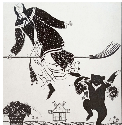
Рис. 8. Анастасія Фарисей. Хуха. Ілюстрація до артбуку "Польові нариси"(2022, с.58)

Стилістика ілюстрації побудована таким чином, що глядач змушений уважно вдивлятися в зображення, шукаючи приховані образи. Це перетворює сприйняття візуального зображення на активний аналітичний процес і створює ефект взаємодії між ілюстрацією та