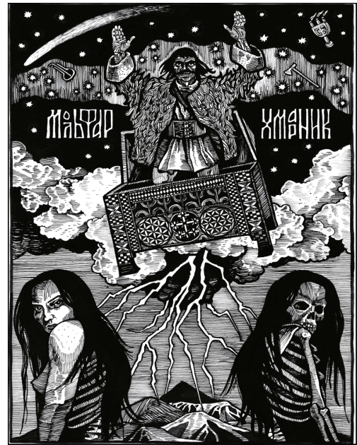
Рис. 3. Валентин Колонтай. Мольфар. Ілюстрація до артбуку «Польові нариси» (2022, с.83)

Стилістика ілюстрації поєднує гравюрну фактуру з обмеженим використанням кольорових акцентів, що підсилює напружений емоційний стан образу та сприяє його архетипізації. Відмова від реалістичної деталізації обличчя й тіла дозволяє уникнути конкретизації персонажа та зберегти багатозначність інтерпретації. Такий підхід підтверджує ефективність стилізованого зображення міфологічних