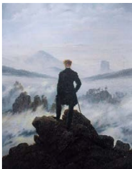
Рис. 9. Каспар Девід Фрідріх «Мандрівник над морем туману» [9]

Простежимо їх прояв на прикладі Пропілей Афіньського акрополя. Так, зона відокремлення формується на підході до Пропілей: виступаючі вперед крила споруди створюють відчуття межі та спрямовують рух відвідувача всередину, позначаючи умовну лінію переходу від міського середовища до сакрального комплексу. Далі настає зона переходу, або лімінальності, що розгортається у центральній частині Пропілей – у просторі колонади. Рух крізь ряди колон створює стан «поміж», коли людина вже залишає звичний міський простір, але ще не досягає священної території Акрополя; тут відбувається символічний розрив із попереднім станом і підготовка до нового. Завершує послідовність зона інкорпорації, що настає після подолання останнього порогу Пропілей