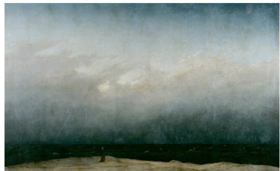
Рис. 10. Каспар Девід Фрідріх «Чернець біля моря» [21]