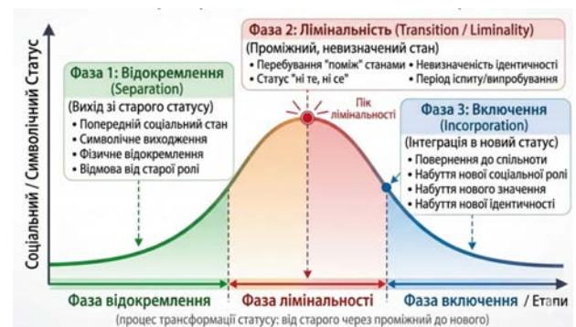
Рис. 5. Тріадична модель ритуалів переходу Арнольда ван Геннепа

не лише антропологічні ритуали, але й просторові процеси як форми символічного переходу [23] (рис. 5).