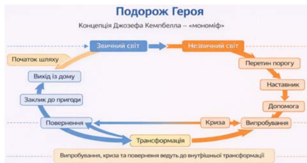
Рис. 3. Структурна схема мономіфу Джозефа Кемпбелла («подорож героя») як моделі драматичної та внутрішньої трансформації персонажа [Автори, OpenAI. ChatGPT. Київ : OpenAI, 2026].

Вагомий внесок у розуміння універсальної структури драматичної дуги зробив Джозеф Кемпбелл (Joseph Campbell), сформулювавши концепцію «мономіфу» – універсальної моделі «подорожі героя», що складається з послідовних етапів: від виходу зі звичного середовища через перетин порогу, випробування й кризу – до трансформації та повернення (рис.3). Учений описує цю подорож як серію переходів, у кожному з яких герой зазнає внутрішньої зміни. Дана модель демонструє, що драматична структура ґрунтується не лише на зовнішньому конфлікті, а й на внутрішній трансформації. Саме тому концепція «подорожі героя» стала однією з ключових засад сучасного сценарного мистецтва. Кемпбелл Д. довів, що ця схема відтворюється в міфології, літературі та сучасному кінематографі, відображаючи архетипічну логіку переживання трансформації [8].