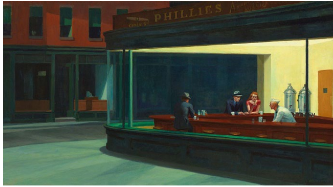
Рис. 6. Едвард Гоппер «Нічні яструби» [3]