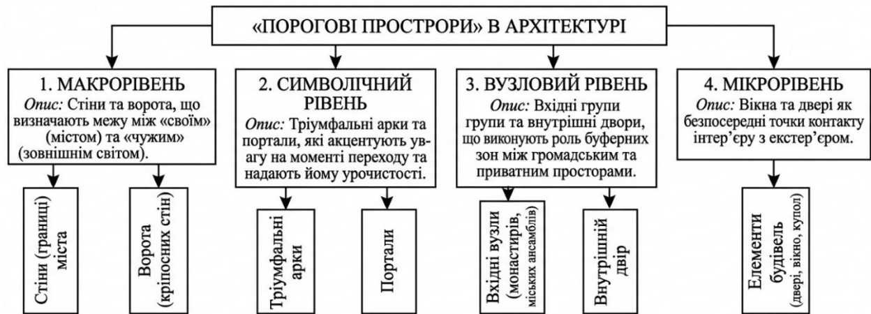
Рис. 4. Порогові простори в архітектурі за Г.Л. Коптьовою [2, с. 35]

між зовнішнім і внутрішнім простором. У містобудуванні це: вхідна група будівлі; аркада, галерея, перехід під аркою або над дорогою; площі та відкриті просторові переходи між кварталами. Такі зони формують зміну уваги й поведінки людини. Проте, як засвідчує аналіз, пороговий простір не зводиться до окремої локалізованої точки. У низці випадків він набуває протяжного характеру та розгортається як просторово-часова послідовність морфологічних змін – варіацій масштабу, ступеня відкритості, освітленості, акустичних параметрів і траєкторії руху. За таких умов поріг функціонує не лише як геометрично фіксована межа, а як процесуальна структура переходу.