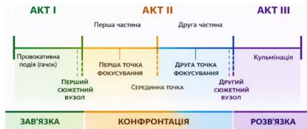
Рис. 2. Кіно парадигма Сіда Філда [Автори, OpenAI. ChatGPT. Київ : OpenAI, 2026].

подальшим спадом. При цьому він наголошував на значенні так званих «точок-гачків» (plot points) як структурних переломів, що спрямовують розвиток дії, підтримують напругу та утримують глядацьку увагу через механізм очікування подальшого розвитку подій [12] (рис. 2).