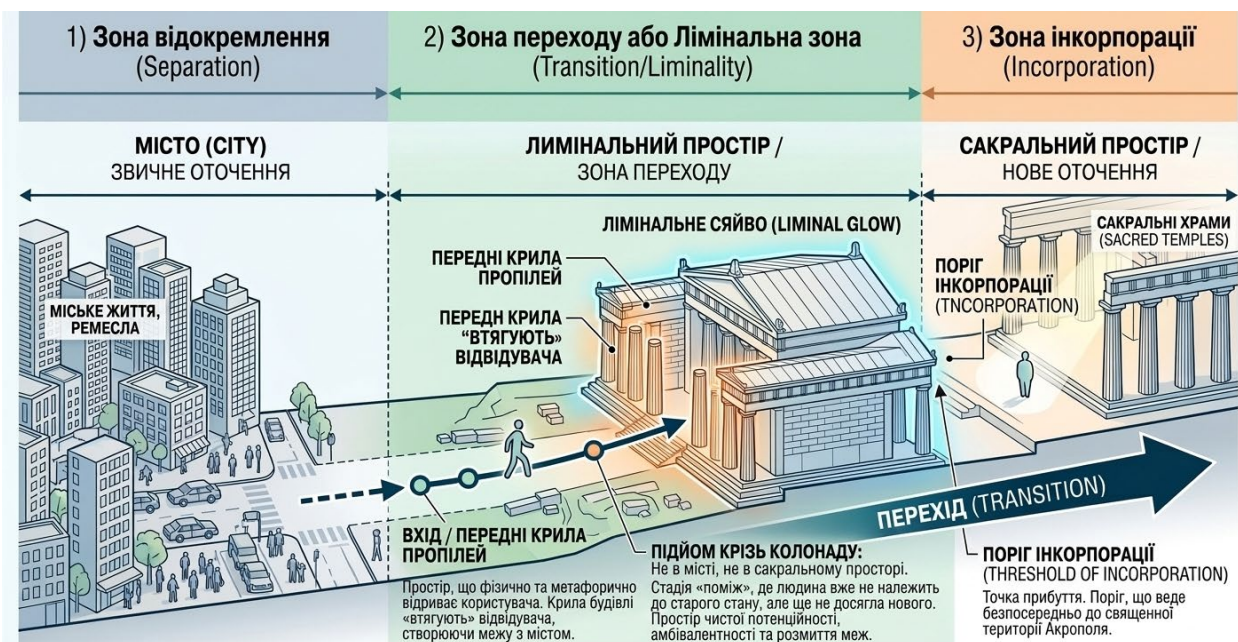
Рис. 11. Концептуальна схема трьох етапів лімінального простору на прикладі Пропілей Афіньського акрополя [Автори, OpenAI. ChatGPT. Київ : OpenAI, 2026]

Таким чином, пороговість у міському середовищі можна розглядати не лише як морфологічну характеристику просторових переходів, а як механізм формування лімінального