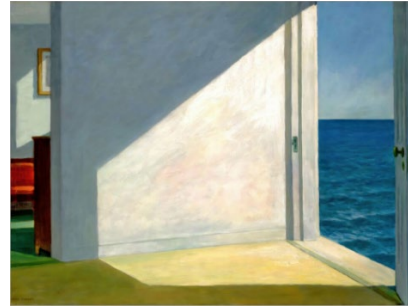
Рис. 8. Едвард Гоппер «Кімнати біля моря» [11]

отвір; фігура, зафіксована на межі входу чи виходу, – усі ці композиційні засоби формують ефект лімінальності.