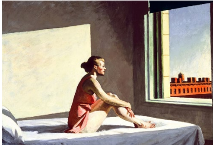
Рис. 7. Едвард Гоппер «Ранкове сонце» [1]