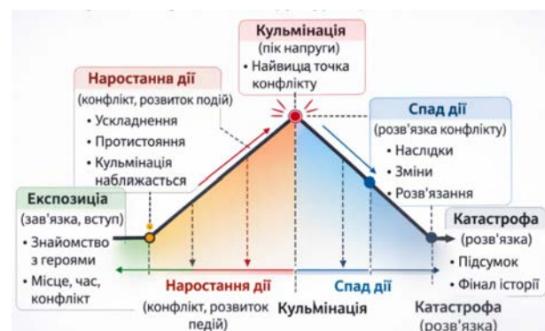
Рис. 1. Піраміда Фрейтага: структура драматичної дії [Автори, OpenAI. ChatGPT. Київ : OpenAI, 2026].

Будь-який художній твір, літературний, театральний чи кінематографічний організовується відповідно до законів драматургії та вибудовується за принципом драматичної дуги. Ще у трактаті «Поетика» Арістотель визначив структуру трагедії як цілісну дію, що має початок, середину та кінець, підпорядковані логіці розвитку подій і внутрішній необхідності. Надалі ця модель трансформувалася у концепцію п'ятиступінчатої структури побудови дії, відому як «піраміда Фрейтага» («Freytag's Pyramid»), що включає експозицію, наростання, кульмінацію, спад дії і розв'язку [13, с. 114–120] (рис. 1).