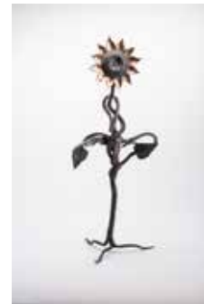
Рис. 7. Кований хрест. Курус Годівала. Англія

культурного містка, поєднуючи локальні традиції авторів із солідарністю до української боротьби.