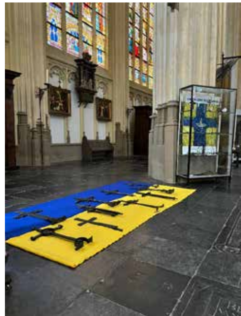
Рис. 2. Експозиція кованих хрестів у Бельгії