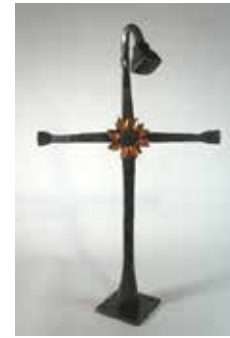
Рис. 6. Кований хрест. Пауль Клаасен. Нідерланди