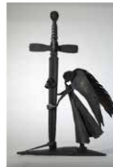
Рис. 8. Кований хрест. Вігінтас Адомавікіус. Литва (правовласник світлини – ГО «Свято ковалів»; керівник – В.М. Вінтоняк)

Глибоким символізмом і філософською напругою вражає кований витвір литовського майстра Вігінтаса Адомавікіуса (рис. 8). Ангел, що обіймає меч-хрест, постає як утілення духовної скорботи й водночас внутрішньої сили. У цьому жесті немає тріумфу – лише тиха, глибока покора та прийняття болю як частини