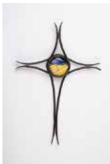
Рис. 13. Кований хрест. Люсіль Скотт. Англія (правовласник світлини – ГО «Свято ковалів»; керівник – В.М. Вінтоняк)