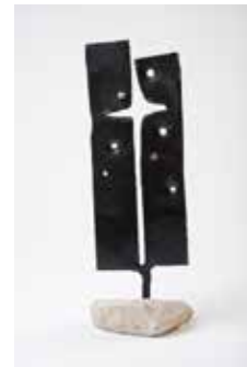
Рис. 15. Кований хрест. Флавіо Парра Ортіз. Чилі