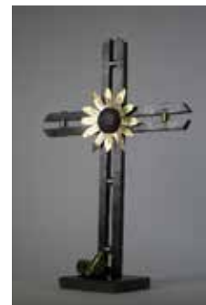
Рис. 16. Кований хрест. Магнус Нільсон. Швеція