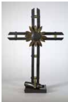
Рис. 5. Кований хрест. Магнус Нільсон. Швеція