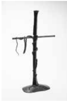
Рис. 11. Кований хрест. Бредлі Вілс. Англія (правовласник світлини – ГО «Свято ковалів»; керівник – В.М. Вінтоняк)