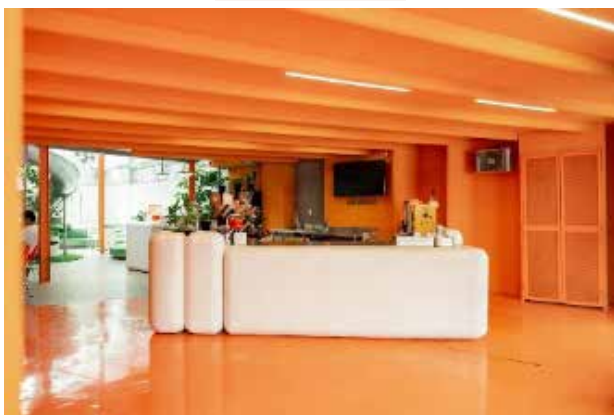
Рис. 1. Cantel Braga Coffee Café: приклад масштабування елементів візуальної ідентичності в інтер'єр (переважання помаранчевої гама як носія впізнаваного коду простору) [10]

суперграфіка описана як поєднання графічних елементів, спрямоване на сильне враження, привертання уваги та побудову професійного образу установи, а функції візуальної ідентичності подані як маркер належності, засіб ідентифікації, інструмент промоції та показник цілісності (рис. 2–3).