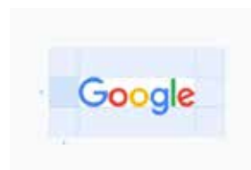
Рис. 4. Приклад правила «вільного поля» навколо логотипу як елементу регламенту застосування [13]