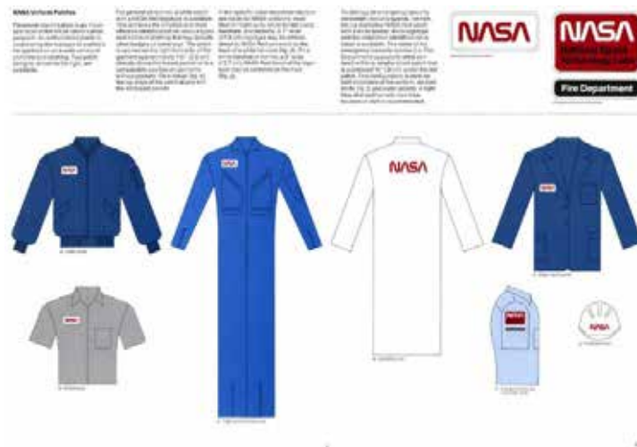
Рис. 6. Фрагмент стайлгайду як приклад інструмента, що фіксує правила впровадження айдентики на різних носіях [17]

Отже, наведені кейси дозволяють узагальнити, що практична реалізація візуального образу бренду спирається на повторювані патерни, які узгоджуються з теоретичними підходами, окресленими раніше. У сукупності ці приклади підтверджують, що формування візуального образу бренду в цифрових медіа є результатом поєднання смислової інтерпретації знаків, системної організації елементів айдентики та процедурної дисципліни впровадження, яка забезпечує послідовність образу в різних носіях і форматах.