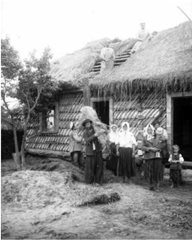
Рис. 10. Зображення з архіву «Атлас українського традиційного житла», покриття даху соломкою, Київщина, 1911 р. [7]