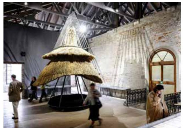
Рис. 9. Загальний вигляд українського павільйону DAKH (ДАХ): Vernacular Hardcore у залі Арсенале, 2025 р. [7]

Вернакуляр на бієналі 2025 року трактувався у традиційному сенсі – «архітектура без архітекторів», спираючись на етнічні практики будівництва дахів, досліджені