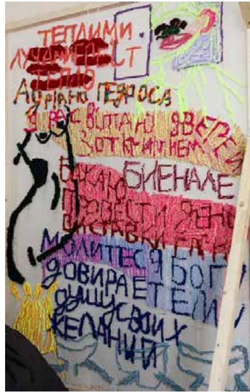
Рис. 11. Частина проекту «Плетіння сіток» (процес візуалізації інсталяції «Щирі привітання» Бучацької К.), 2024 р. [7]

в «Атласі традиційного народного житла». Одночасно була присутня апеляція до стихійної вернакулярної архітектури в контексті війни та відновлення. Тобто йшлося про два типи вернакуляра: традиційний та екстремний, з посиланнями на діяльність таких проєктів, як «Лівий берег» і KHARPP, що відновлюють будинки в прифронтових регіонах [7].