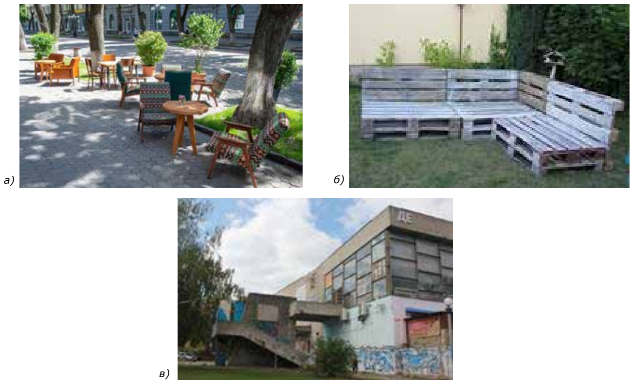
Рис. 2. Домашні меблі в кафе як приклад тактичного урбанізму в м. Полтава (а) [15], лавка з піддонів, приклад дешевого тактичного урбанізму (chairbombing) у м. Чернігів (б) [9]; невикористана міська територія волонтерського центру «Блокпост Підкова» у м. Вінниця (Build the Better Block) (в) [18]

Громадські погляди учасників сквоттерського руху варіювалися, виходячи з індивідуальності кожної особи та колективу, наприклад, у київському Squat 17b (рис. 4). Їх функції включали проживання, розвиток альтернативного мистецтва та політичну активність [4].