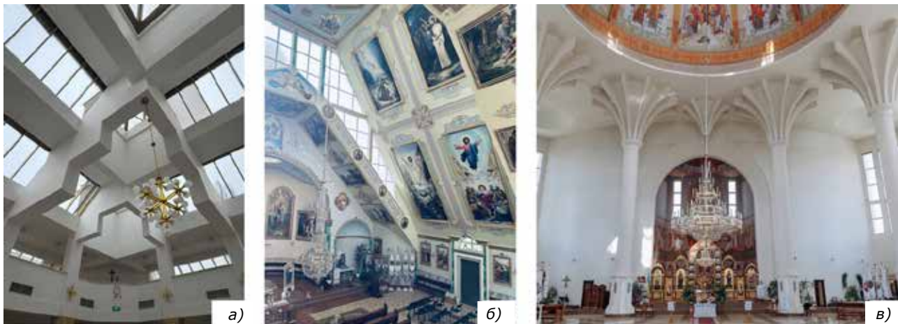
Рис. 2: а) фрагмент інтер'єру церкви Василя Великого на Вознесенському узвозі в Києві; б) інтер'єр церква Святого Апостола Юди-Тадея в м. Івано-Франківську; в) інтер'єр церкви парохії Різдва Пресвятої Богородиці в м. Новий Розділ Львівської обл.

сучасним технологічним та естетичним можливостям храмовбудування.