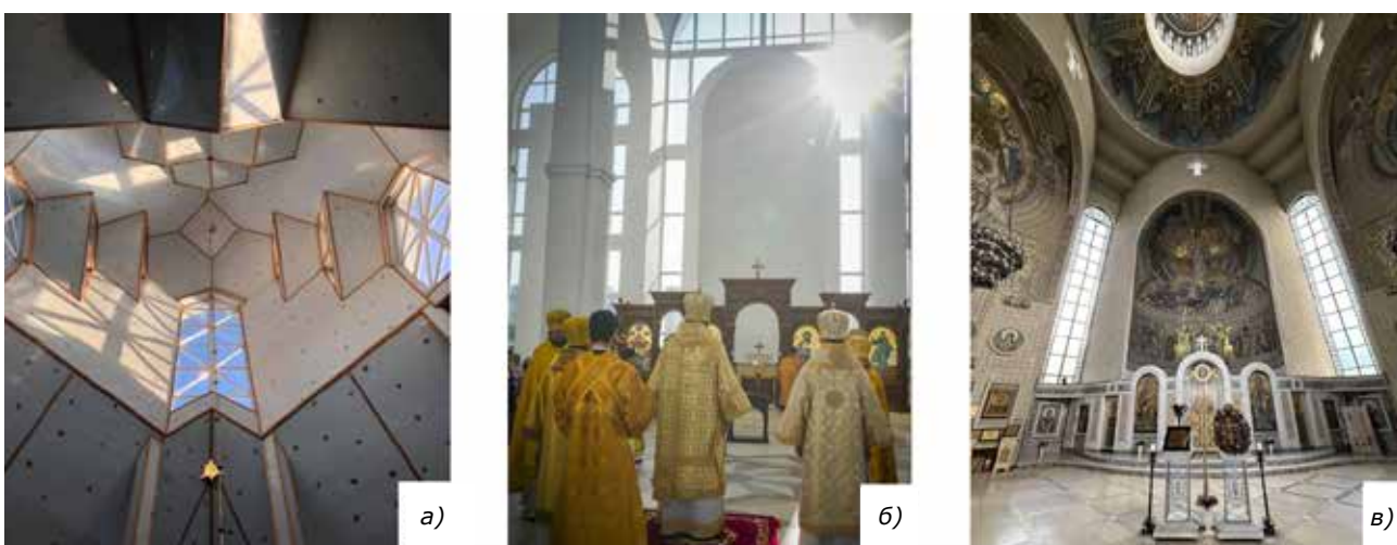
Рис. 3: а) підкупольний простір церкви Покрови Пресвятої Богородиці в м. Яворів Львівської обл.; б) інтер'єр храм св. апостола Андрія Первозванного і всіх святих у м. Бучі Київської обл.; в) інтер'єр Спасо-Преображенського собору в м. Києві

Розвиток української храмовбудівної практики кінця ХХ – початку ХХІ ст. демонструє формування кількох виразних типологічних моделей, що віддзеркалюють як