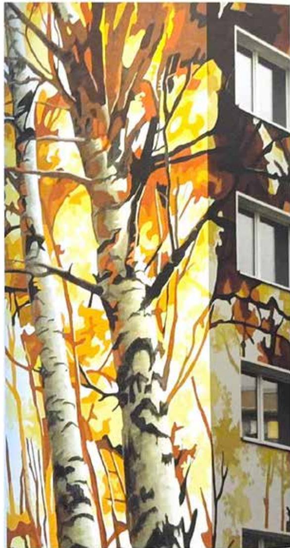
Рис. 4. Житловий район Фріца Хекерта. Мурали на житлових будівлях: ліворуч: вул. Арно-Шрейтер, 83, праворуч: вул Ам Хартвальд, 64–72