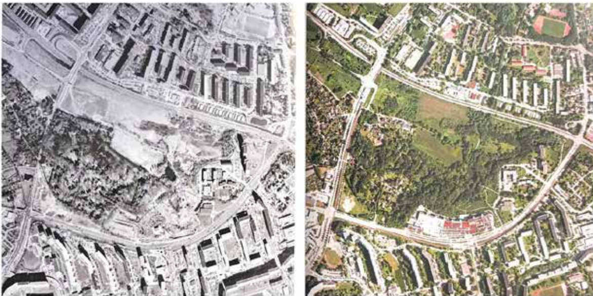
Рис. 3. Житловий район Фріца Хекерта. Ліворуч: аерофотознімок 1996 року; праворуч: аерофотознімок 2009 року

Одним з показових прикладів знесення стала трансформація восьмої будівельної ділянки. У 2008–2009 роках було демонтовано кілька секцій підковоподібної житлової будівлі на південно-західній околиці району по вулиці Макса Опіца (Max-Opitz-Straße). На звільнених територіях згодом реалізовано малоповерхову житлову забудову. Серед інших демонтованих об'єктів варто відзначити житлові будинки за адресами вул. Маркерсдорфер (Markersdorfer Straße), 143–147 (межа ділянок № 5 та 8) і вул. Йогана Ріхтера (Johann-Richter-Straße), 9 (ділянка № 5), що ілюструє масштаб і системність