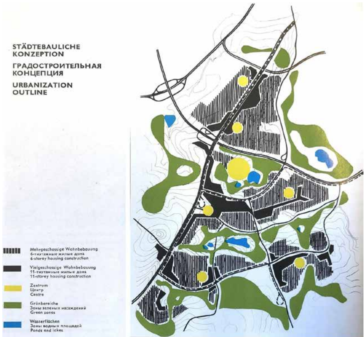
Рис. 2. Житловий район Фріца Хекерта. Містобудівна концепція

стоянки та гаражі переважно виносилися на периферію району, тоді як внутрішні простори формувалися як безперервна мережа пішохідних зон з мінімізацією транзитного руху. У місцях інтенсивних перетинів транспортних потоків планувалося застосовувати підземні та наземні пішохідні переходи.